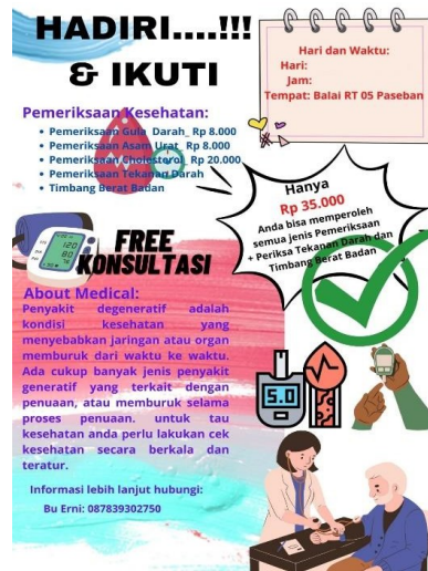
Gambar 3. Media informasi kegiatan

Ketercapaian sasaran dari program ini menunjukkan pengurus mampu membuat media publikasi yang menarik, baik untuk kebutuhan internal maupun eksternal organisasi. Jumlah media publikasi yang diproduksi oleh organisasi meningkat secara signifikan.