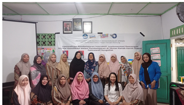
Gambar 3. Pelatihan Guru TK Gugus Fatmawati Sungailiat

oleh 15 peserta guru dari persatuan guru TK pada Gugus Fatmawati Sungailiat, termasuk guru TK Tunas Jaya. Peserta sangat antusias mengikuti pelatihan ini. Kegiatan ini dapat dilihat pada Gambar 3 di bawah ini.