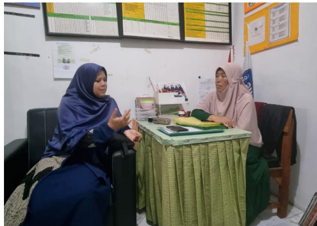
Gambar 2. Wawancara dengan Kepala Sekolah TK Tunas Jaya

Pada tahap analisis kebutuhan, tim pengabdian melakukan wawancara dan observasi langsung ke pihak TK Tunas Jaya. Agenda ini dapat dilihat pada Gambar 2 di bawah ini.