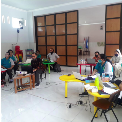
(a) Pemberian materi

Dokumentasi kegiatan pendampingan dapat dilihat pada Gambar 1, pada Gambar 1a adalah kegiatan pemberian materi pengenalan dan proses instalasi, sedangkan pada Gambar 1b kegiatan pendampingan.