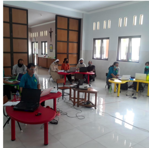
(b) Kegiatan pendampingan