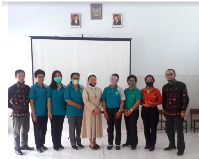
Gambar 2. Penutupan kegiatan

Pada Gambar 2 adalah kegiatan penutupan kegiatan PkM yang berlokasi di sekolah mitra.