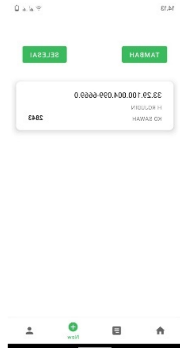
(f) Tampilan Input Lahan