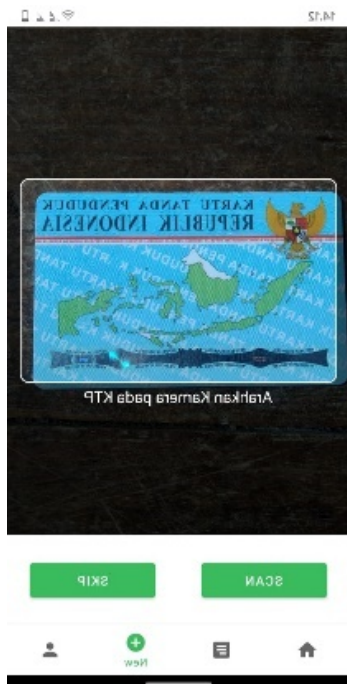
(d) Tampilan Scan KTP