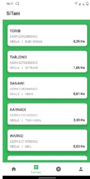
(b) Tampilan Daftar Petani