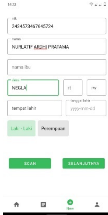
(e) Tampilan Input Petani